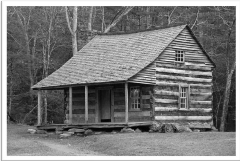
Einfaches Wohnhaus in Amerika aus der damaligen Zeit